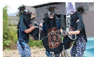
百津獅子組 神楽舞／演目：角題、一本網