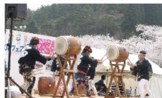
雷太鼓 太鼓／演目：組太鼓、曲打ち