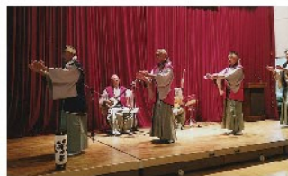
五泉帛の帯保存会 民謡／演目：帛の帯