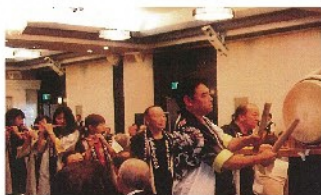
五泉木遣り保存会 木遣り／演目：五泉木遣り