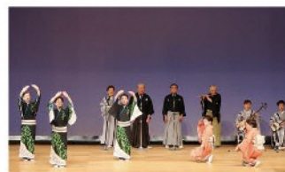
新潟市民謡連盟 民謡／演目：新潟甚句、新潟おけさ