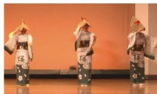
村松民謡協会・村松甚句保存会 民謡／演目：村松甚句