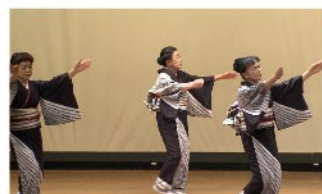
津川民謡保存会 民謡／演目：じよんがら女節、阿賀野川舟謡、港甚句