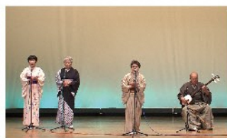
加賀民謡会 民謡／演目：ソーラン節、おこさ節、ドンパン節