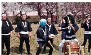
沼垂木遣り太鼓会 木遣り／演目：沼垂木遣り太鼓