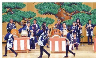
松浜盆踊り太鼓保存会 太鼓／演目：盆踊り太鼓