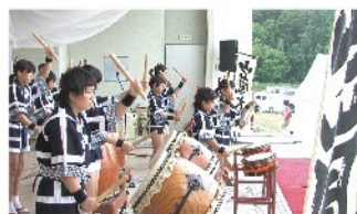
阿賀芸能子ども連「鼓若嵐」 太鼓／演目：祭ばやし、山嵐太鼓