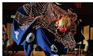
栄町神楽保存会 神楽舞／演目：御舞、鈴舞