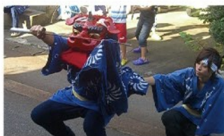
門前神楽保存会 神楽舞／演目：神楽舞、四ッ剣