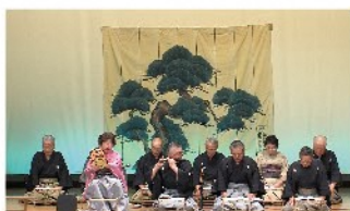
阿賀町津川石宝会 謡曲／演目：謡曲、居囃子、鶴亀