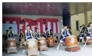
松井町太鼓の会 太鼓／演目：みのり太鼓、祭りばやし