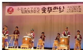
稲荷町水原甚句の会 漁火 民謡／演目：漁火太鼓、神曲