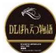
ヘッドマークデザイン

※1号車(オコジョルーム及びオコジョ展望室)・2号車(普通車指定席)は車両の定期検査のため、連結はありません。