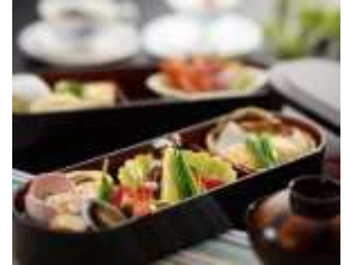
咲花きなせ堤河床と昼食(お弁当)