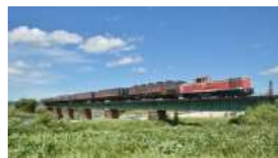
DL(ディーゼル機関車)「DE10」 +「ばんえつ物語」客車

※1号車(オコジョルーム及びオコジョ展望室)・2号車(普通車指定席)は車両の定期検査のため、連結はありません。