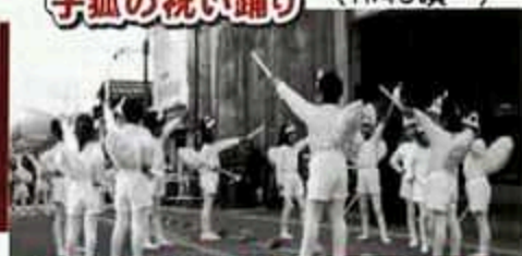
嫁入り行列の日の踊りを園児が再現

花嫁・花婿さんが、半年ぶりにお土産もって里がえり!! 市場では花嫁、花婿とふれあい、珍しいなり寿司や 各店自慢の品が勢ぞろい! にぎやかで楽しい交流市場にどうぞお立ち寄りください!