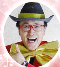
漫談 中野小路たかまる